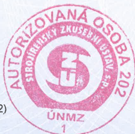
Ing. Tomáš Hruška ředitel

202/C5/2013/B-30-00151-13-rev. 5 Strana 1 (2)